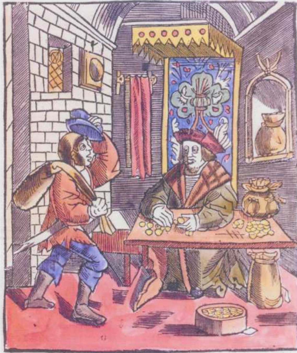
Der arme Bauer beim Wucherer. Holzschnitt um 1522.